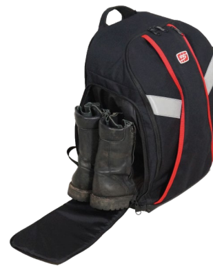
Rangement effets chaussants