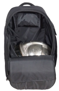
Rangement du casque en quinconce sur effets chaussants